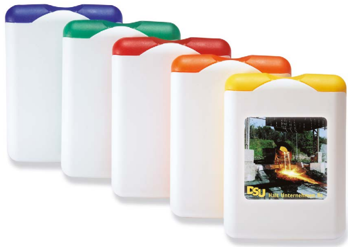
»First-Aid« Art.Nr. 1651