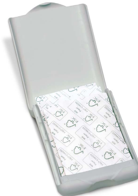
»ECO« Art.Nr. 1681