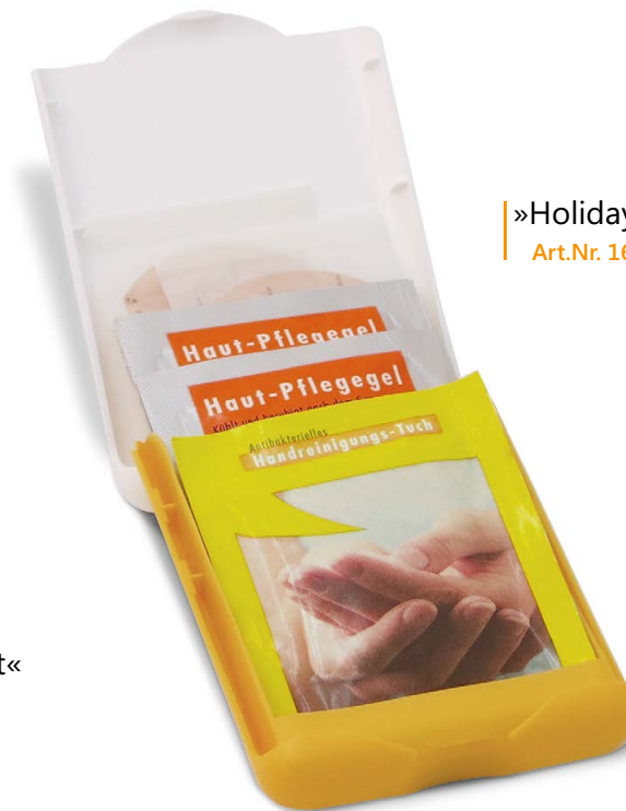
»Holiday« Art.Nr. 1661