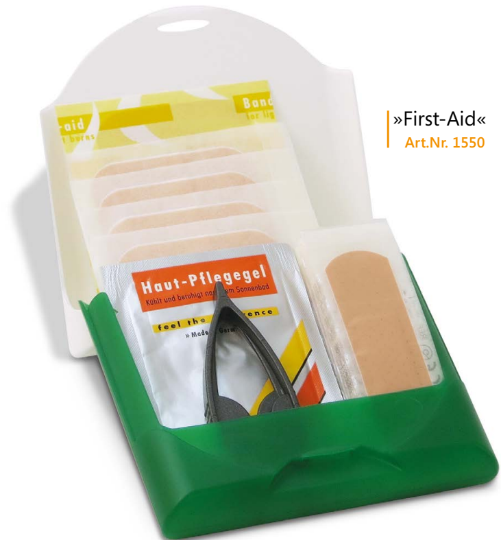
»First-Aid« Art.Nr. 1550