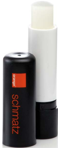
12 | vollschwarz