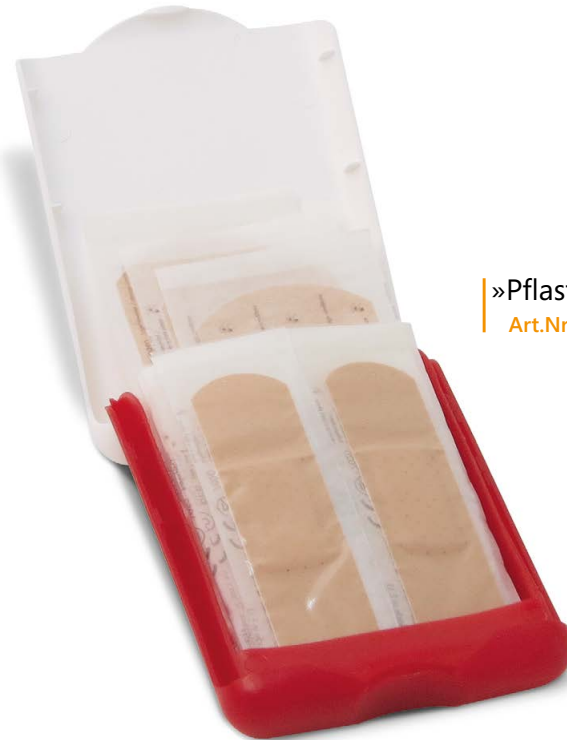
»Pflaster-Set« Art.Nr. 1671