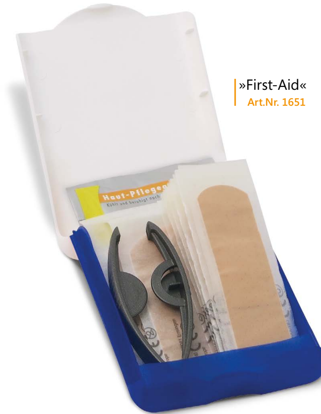
»First-Aid« Art.Nr. 1651